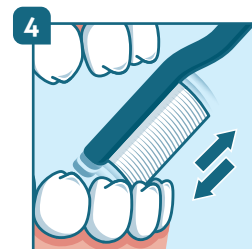
4 Dents de devant : placer la brosse verticalement en allant toujours de la gencive vers la dent.